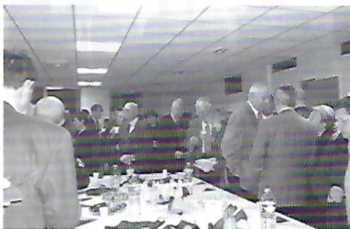
Le cocktail à l'Institut des Sciences Urbaines

La réunion s'est achevée par un cocktail fort sympathique.