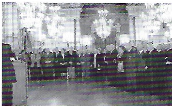
Une partie des nombreux invités décorés de la L.H. ou de l' O.N.M.

Cette réunion, maintenant traditionnelle, nous a permis de rencontrer de nombreux nouveaux nommés et promus et ainsi de susciter des adhésions, immédiates et futures.