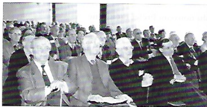
L'assistance particulièrement nombreuse cette année.

Conformément aux statuts, ces rapports sont soumis aux votes des sociétaires présents ou représentés ; ils sont approuvés à l'unanimité.