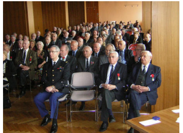
...devant une assistance nombreuse et attentive