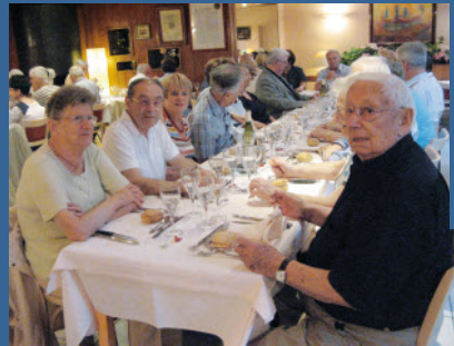
Repas à l'hôtel Azur à la Freyssinouse, soirée conviviale.