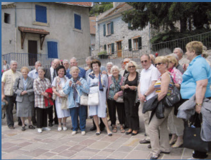
Le Groupe devant l'église de Montmaur.

Le premier arrêt est historique au château de Montmaur cette salle avec une cheminée monumentale caractérisée par de splendides gypseries.