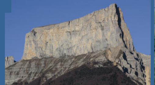
C'est le mont Aiguille à la limite du Trièves et du Vercors qui nous valut d'admirer un dernier « monument naturel ».