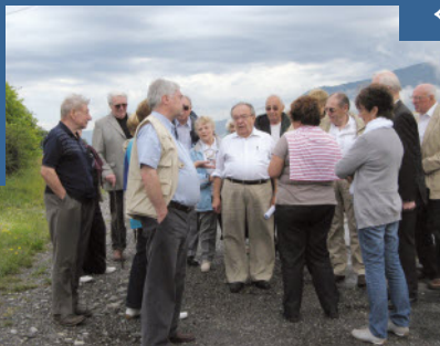
Discussion "Géologique" dans la vallée glaciaire.