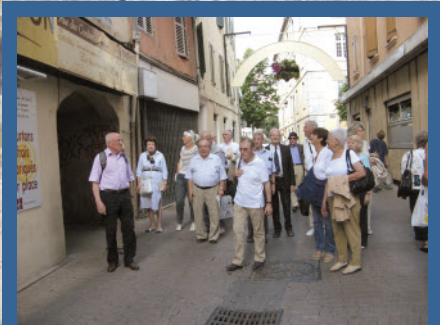
Visite pédestre de « Vapincom » le Gap romain.