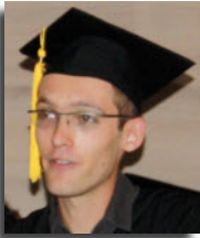
Le Major de Promotion