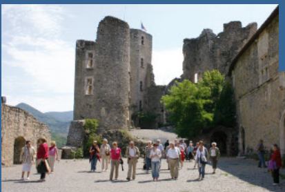
La partie la plus ancienne du château de Tallard