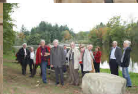
Pause reposante à l'arboretum.