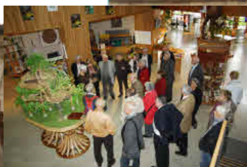
Galerie Européenne de la Forêt et du Bois