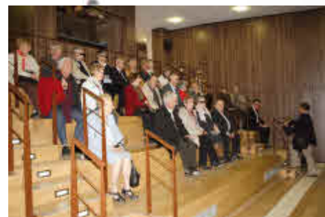
Présentation du film 3D à Cluny.