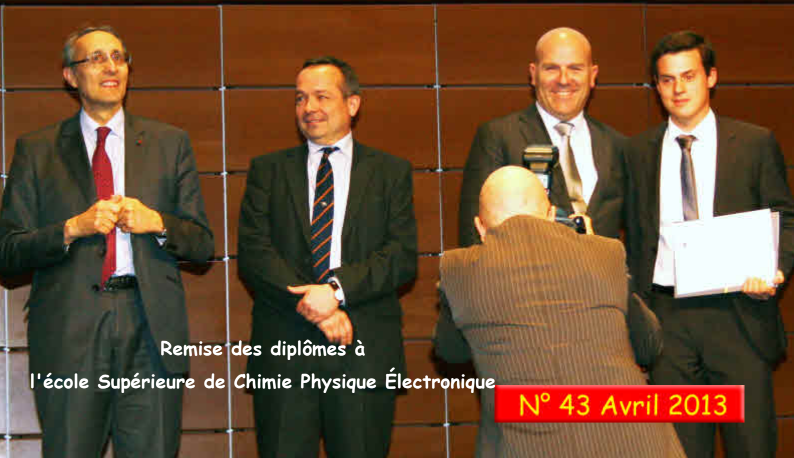
Remise des diplômes à l'école Supérieure de Chimie Physique Électronique