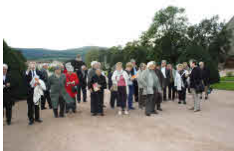
Le groupe à Cluny.

Le voyage d'automne nous a conduit à Cluny et Dompierre les Ormes.