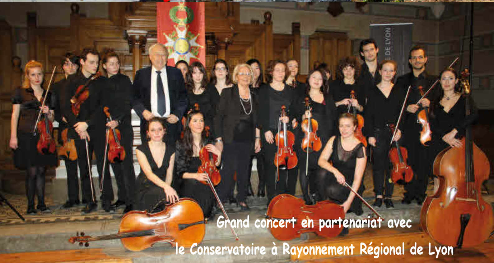
Grand concert en partenariat avec le Conservatoire à Rayonnement Régional de Lyon