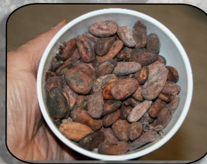
« fèves de cacao » après torréfaction