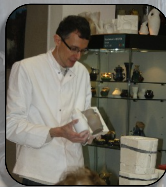
Naissance d'un pichet