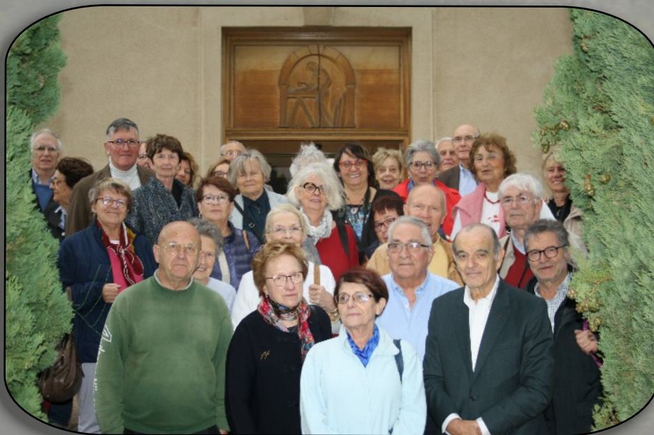
Le cadre de verdure limite la photo de famille !