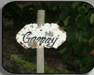
Du gamay, on est pourtant pas en beaujolais !