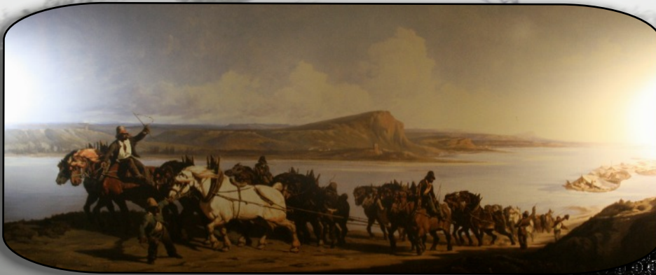
Avant l'invention de la vapeur

Puis la RN 88 par la rive droite du Rhône, en traversant la cité historique de Tournon, nous fait découvrir la troisième spécificité locale à la « maison du vin de Saint Désirat » qui produit le réputé « Saint-Joseph ». Une pause à Tournon a été l'occasion de découvrir quelques hommes qui se sont illustrés dans l'histoire du Lycée de cette ville.