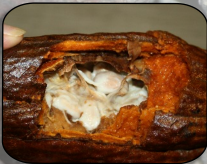
Cabosse préparée par Geneviève