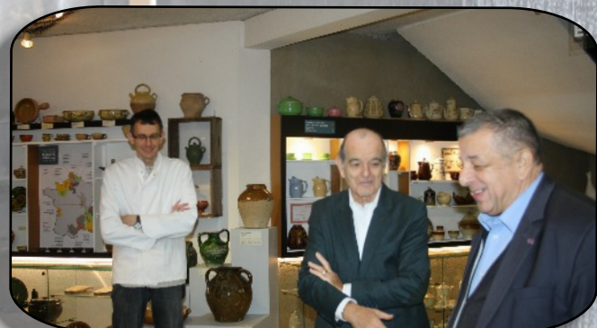
Alors que le Président local de la SMLH nous accueille