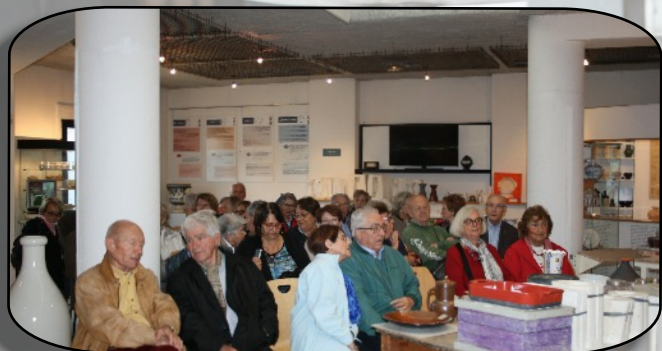
Les élèves sont attentifs